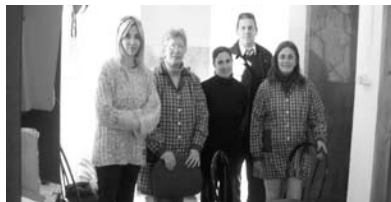
ACATU – Recibiendo PC, Cámara Digital y Sillas