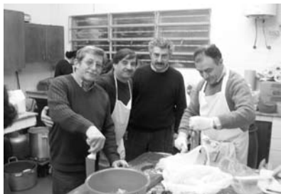
Rotarios haciendo la Paella

Esta actividad año a año es sumamente valorada por todos los rotarios no solo por lo que representa en sí misma sino también por el compañerismo y el esfuerzo mancomunado del club para llevarla a cabo