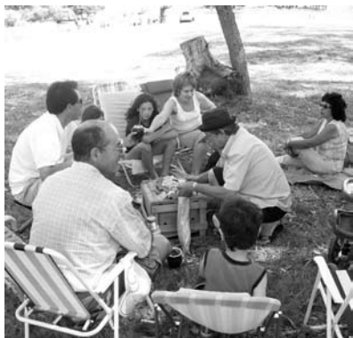
Paseo a Aguas Blancas

También disfrutamos de un hermoso domingo en Aguas Blancas, como paseo en Familia con nuestras señoras e hijos.