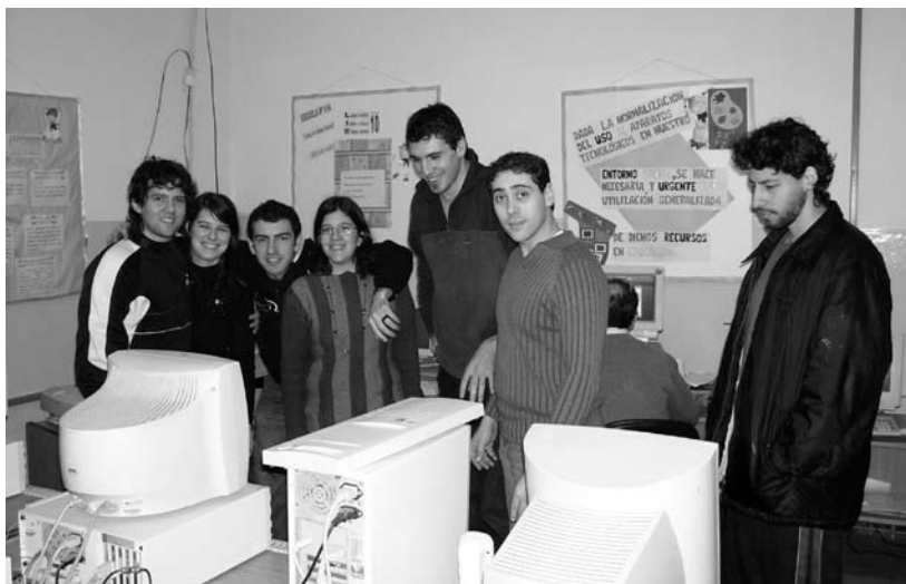
Rotaract reparando las PC de la Escuela 114