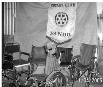
Banco de Sillas de Ruedas

Como hace más de 15 años nuestro club administra un banco con más de 100 sillas, incluyendo actualmente algunos otros elementos tales como bastones, camas, etc.