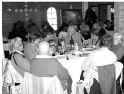
La Familia Rotaria festejando el 40º aniversario de MADER