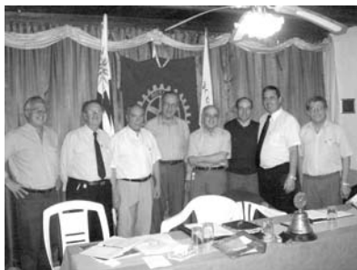
Reunión Conjunta en Tala

Esta avenida de servicio sin dudas tuvo una participación muy activa en este período logrando muchos de los objetivos que el club se había trazado, a saber, existía el anhelo de realizar una reunión conjunta y esto se logro con Rotary Club Tala pero no una sino dos, dado que se realizaron dos magnificas reuniones en cada una de las localidades, con un gran ambiente de camaradería y mucho trabajo rotario.