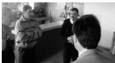
Un PC a Bomberos Pando