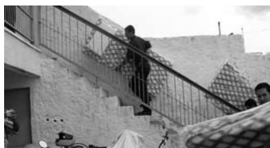
Colchones para Radiopatrulla