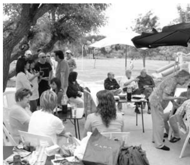
Reunión de la Familia

reclutamos a un nuevo socio), y sobre fin de año organizar con MADER la “ Reunión de la familia ” convocando no solo a los rotarios y a nuestras señoras sino también a nuestros padres y a nuestros hijos y nietos, fue novedoso, emotivo y mas que disfrutable.