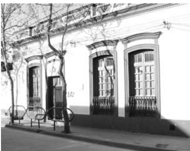
Jardín 222 Un PC, y un cepillo y pasta dental para cada niño