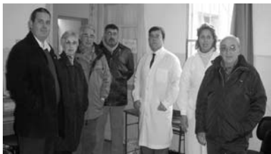
Esc 114 Empalme Olmos recibiendo 2 PC