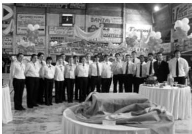
Alumnos de Cocina y Barman de UTU en la Degustación de Vinos

15 bodegueros de nuestra zona exponen sus productos en un marco de mucha distinción, siendo esta actividad sin dudas una de las más importantes de nuestra ciudad. Esta edición, al igual que otras anteriores, contó con el invaluable apoyo económico de BANDES