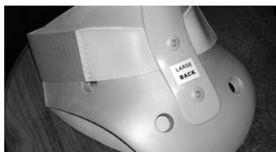
Un Collarín a los Bomberos