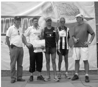
Premiación de la Carrera ROCA04

Es una Actividad co-organizada entre Rotary y CANARIAS SA, edición record de participantes, elogiando a la actividad tanto propios como ajenos, siendo esta edición enmarcada en los 220 años de Pando y declarada por primera vez de Interés Departamental.