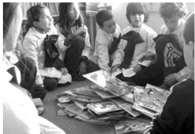
Niños de Esc. 209 Cañada Grande recibiendo su rincón de Lectura