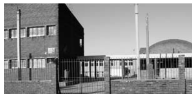
Escuela N° 274, Donación de Bandera y Carteles de PARE