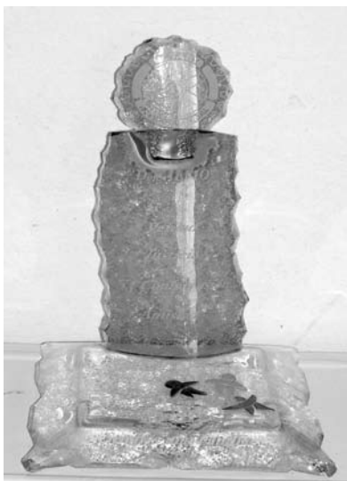
Reconocimiento "Don Alfio"

Un gran logro de esta avenida fue interpretar la vocación del Club de tener un reconocimiento que se pudiese hacer periódicamente a empresas, personas o grupos de personas que se destaquen por su accionar o por su trayectoria. Se imaginaron que fueron muchas las reuniones para definir tanto el nombre como la forma física del mismo, finalmente se realizó una votación a sobre cerrado para definir el nombre que dicho premio tendrá y por mayoría abru-