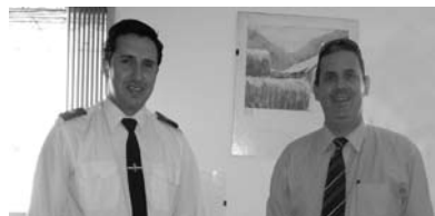
RadioPatrulla Recibiendo PC y Aspiradora (Donacion Conjunta con Taran & Cia.)