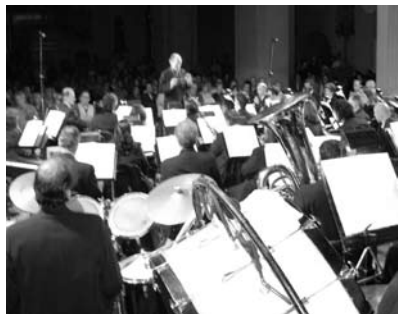
Sinfónica Mpal. Juvenil de Montevideo

Co-organizado con MADER un evento de cierre de año 2007, considerado por nosotros como un regalo cultural a nuestra comunidad ofreciéndole entonces un espectáculo de primer nivel en el marco inigualable que ofrece la Iglesia Inmaculada Concepción de Pando.