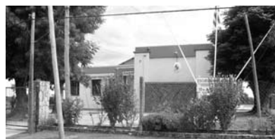
Pintura Exterior Escuela 93