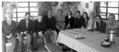
Recibimos Grupo IGE desde Brasil